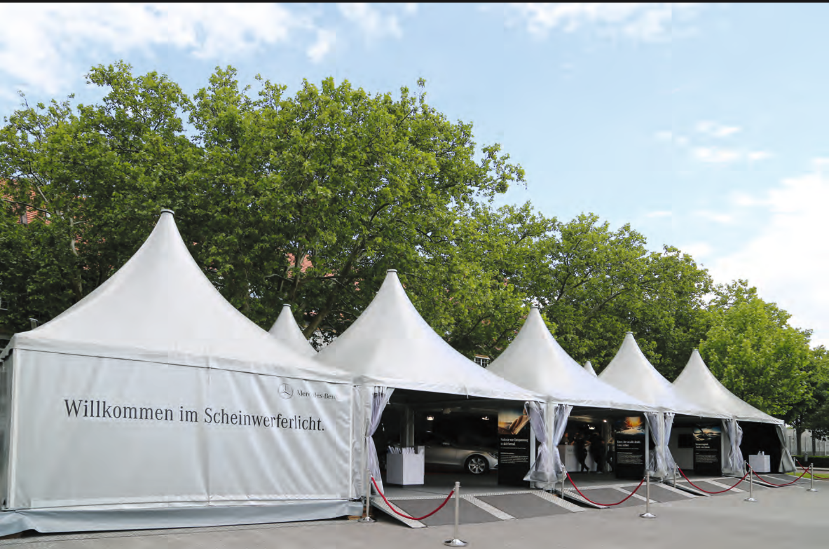
Roadshow in Pagodenzelten